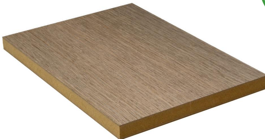
Image d'illustration, non représentative de l'ensemble des produits couverts